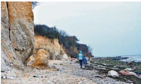
Bei Wind und stürmischer See haben Groß und Klein ihren Spaß.

In Avignon eröffnet im April in der Nähe zum Papstpalast das neue Weinzentrum Carré du Palais. Die Terrasse bietet Ausblick auf den Vorplatz des Palastes, der jedes Jahr 600.000 Besucher anlockt. (tmn)