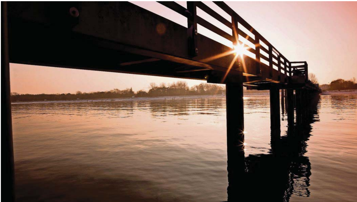
Die Seebäderbrücke im romantischen Abendlicht.